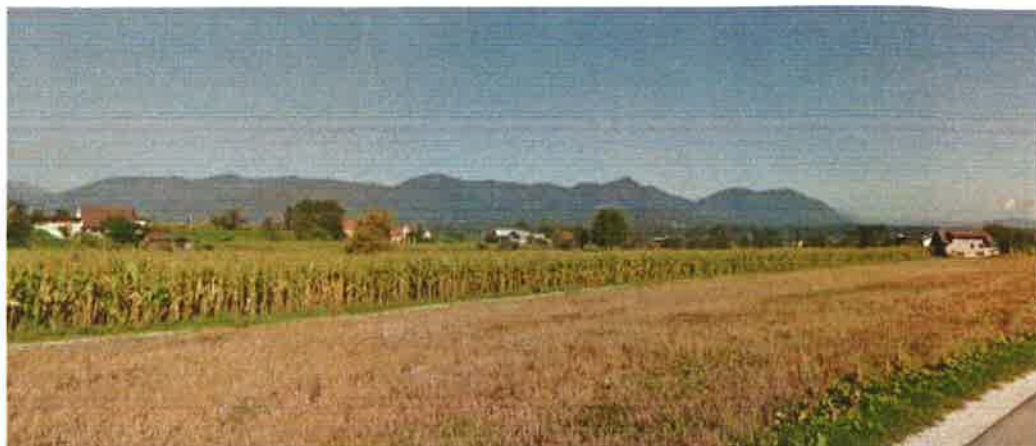
Slike 2.1 Obstoječa trasa pešpoti

Na parceli številka 1307/9, k.o. Ojstriška vas, katere lastnik je Občina Tabor, je trenutno travnato nogometno igrišče brez ustreznih oznak, obrnjeno v smeri sever - jug. Drugih športnih objektov na tem prostoru ni, tako da je zasilna rešitev za rekreacijo uporabnikov.