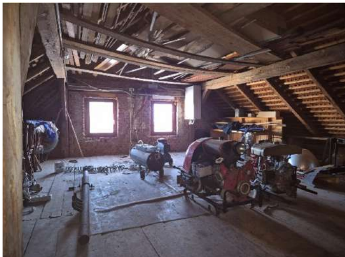
Slika sedanjega stanja.